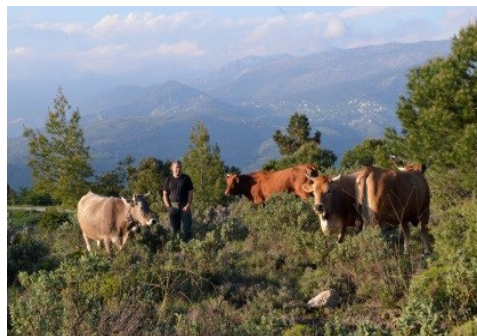
Transhumance hivernale bovine, Èze (Alpes-Maritimes).