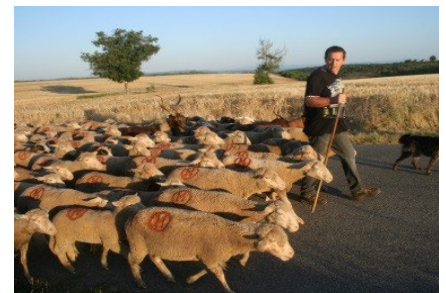
Transhumance ovine à pied, plateau de Valensole (Alpes-de-Haute-Provence).