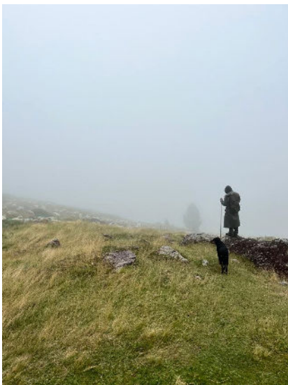
La garde du troupeau par jour de brouillard Cellule pastorale 64

De la même façon, le nombre d'emplois de bergers et de vachers salariés participant à la transhumance aux côtés des éleveurs est aujourd'hui difficile à quantifier au niveau national. Pourtant ce métier est aujourd'hui en pleine évolution et constitue une part importante de la dimension socio-économique de cette pratique. De plus, il prend une part non négligeable dans le renouvellement des générations d'éleveurs, en débouchant pour certains d'entre eux sur une installation.