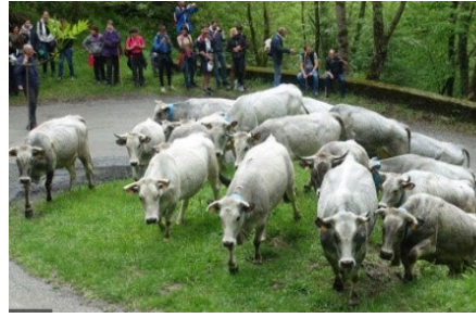
Transhumance dans les Pyrénées ariégeoises, 2018.