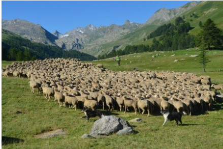
Transhumance estivale ovine, Larche (Alpes-de-Haute-Provence).