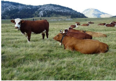
Troupeau de vaches Tarines et Abondance, alpage de Cenise, Glières Val de Borne (Haute-Savoie).