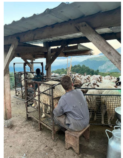
La traite à la main en vallée d'Aspe Cellule pastorale 64.