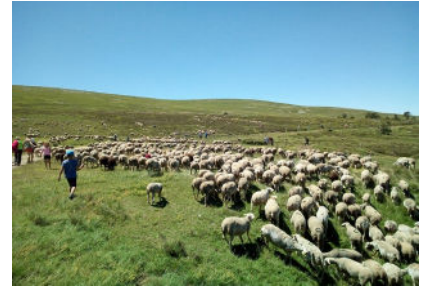
Transhumance Mont Lozère 201