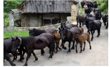
Transhumance des chevaux de Mérens (Ariège), 2018.