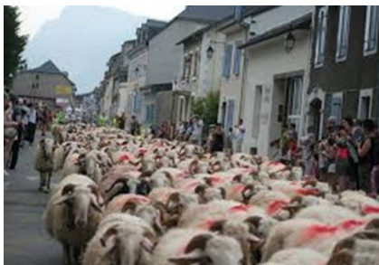
Transhumance en Ossau, 2015.