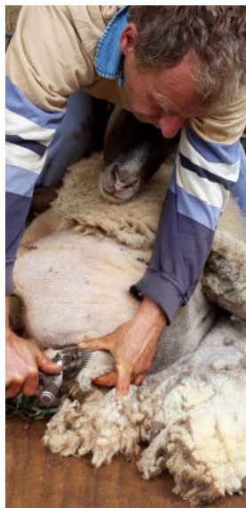
La tonte des brebis