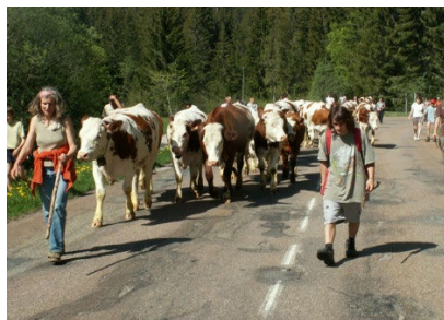
Transhumance dans le Haut-Doubs, Mouthe, 19 mai 2009.