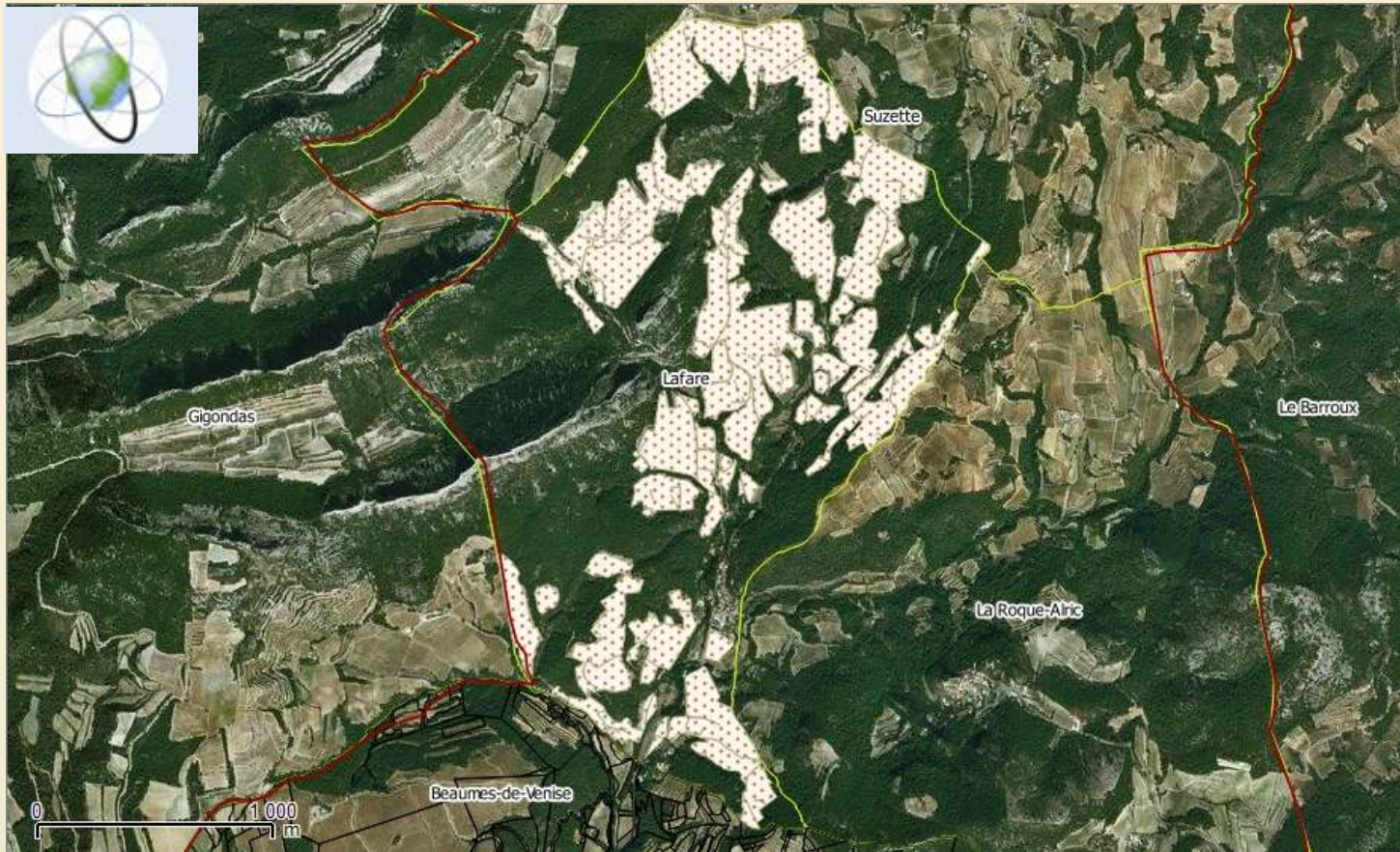
Limites de l'A.O.C Beaumes de Venise dans la commune de Lafare