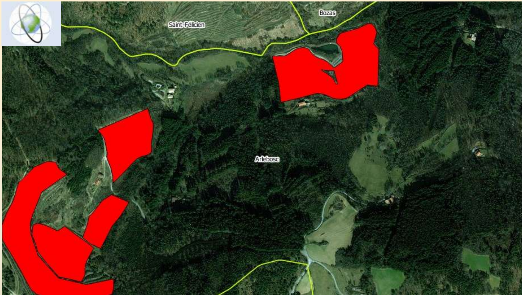
Classe des vergers RPG2012, Arlebosc